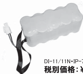
DI-11/11N・IP-701G用電池 税別価格: ¥ 15,000