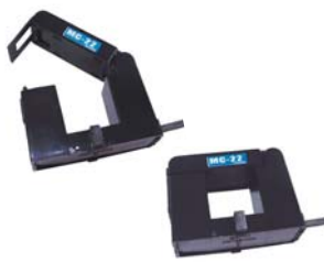
監視王Io・Ior 標準付属品