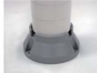
ニコミニ用マグネット付台座