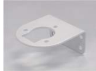
ニコミニ用壁面取付ブラケット