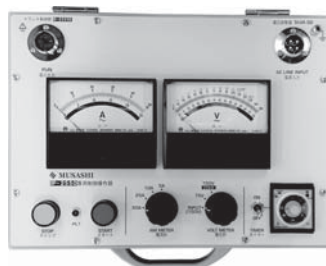
AC25kV 5kVA仕様 制御操作部