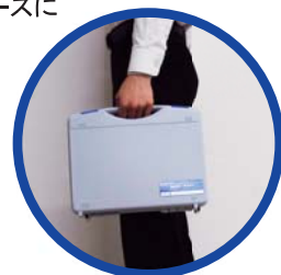
MR-101 (本体) 製品仕様