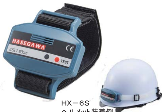
HX-6S ヘルメット装着例