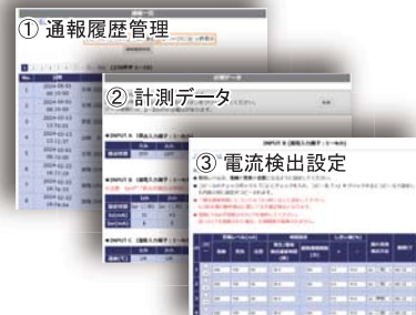
【警報履歴の表示例】