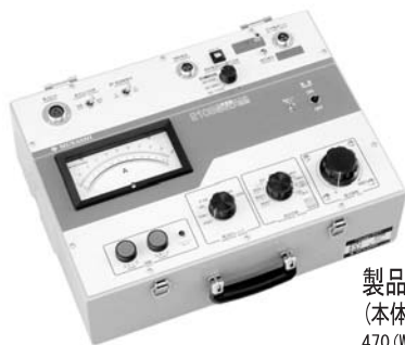
製品No. 2109 税込価格：¥262,500 (本体価格250,000円、消費税12,500円) 470(W)×345(D)×180(H)mm・約18.5kg以下