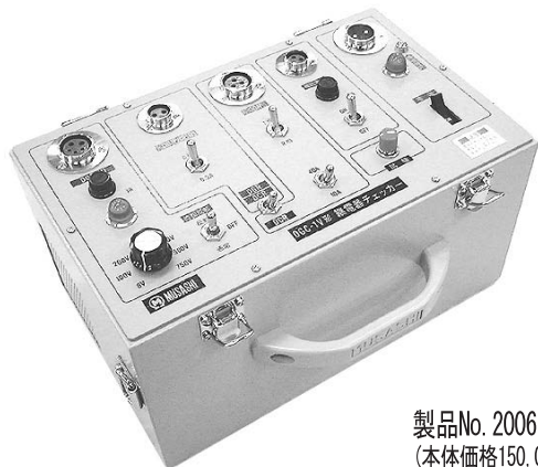
製品No. 2006 税込価格：¥157,500 (本体価格150,000円、消費税7,500円) 320(W)×200(D)×190(H)mm・約7kg以下